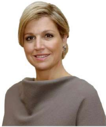
H.M. Queen Máxima of the Netherlands