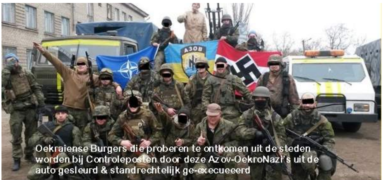
Oekraïense Burgers die proberen te ontkomen uit de steden worden bij Controleposten door deze Az ov-OekroNazi's uit de auto gesleurd & standrechtelijk ge-execueerd