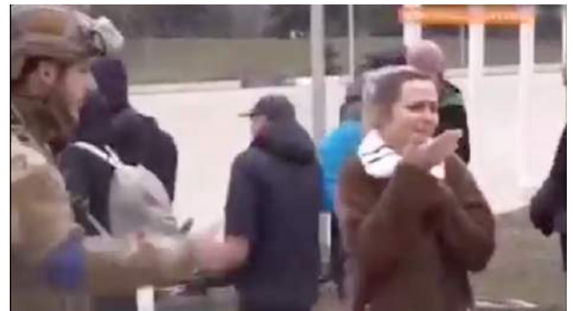
Oekraïense soldaten weigeren de bevolking om Mariupol te verlaten.