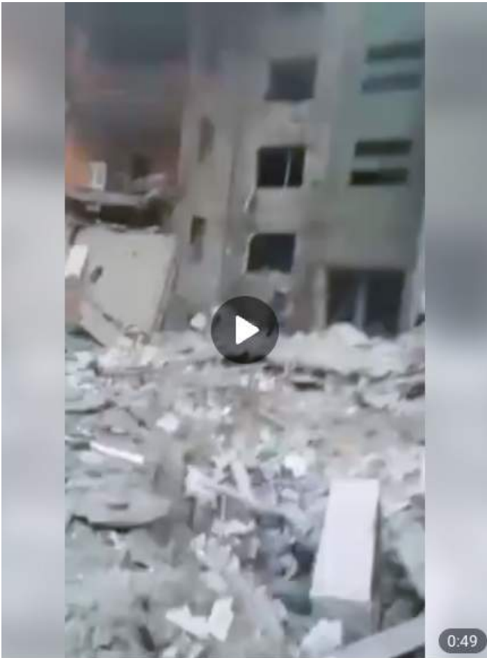
Oekraïners hadden de kans om te evacueren voordat de invasie begon... degenen die achterbleven besloten de wapens op te nemen tegen Rusland... dit is de prijs die ze betaalden... absoluut gruwelijk op zijn zachtst gezegd... wat belangrijk is om hier op te merken is dat geen van deze gebouwen in hun eigen voetafdruk tot stof is vergaan zoals het World Trade Center... 13.6K 01:18