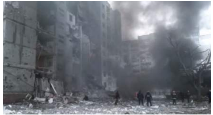
na de genocide op etnische Russen in Oost-Oekraïne, heeft Zelensky wapens uitgedeeld aan criminelen en extremisten om de vernietiging van Oekraïne te verzekeren, net zoals Hitler Duitsland genocide heeft gepleegd en vernietigd... de geschiedenis herhaalt zich en Oekraïners vechten onder een nazi-vlag... 14,3K 01:08