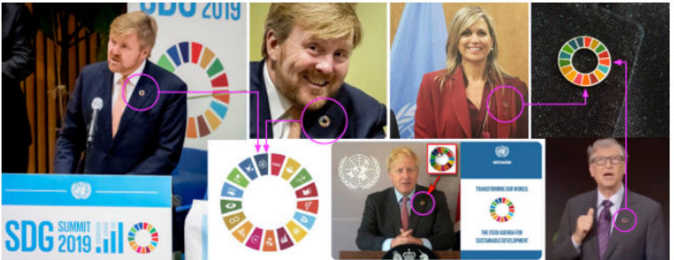
Een sluw plan verpakt in mooie termen en kleurrijke icoontjes, die je als SDG-speld met regenboogkleurtjes op je revers kunt dragen. SDG staat voor Sustainable Development Goals en verwijst naar Agenda 21.

name mainstream journalisten, doodsbang voor zijn. Gelukkig zijn er synoniemen die minder beladen zijn. Zoals: sluw plan, inhumane agenda, machtsgreep, of geheime agenda ter ondermijning van de democratie, zelfverrijking en uitbuiting, et cetera. In de context van Covid-19 kan niemand meer ontkennen dat er een wereldwijde inhumane agenda bestaat, omdat deze steeds zichtbaarder wordt. De coronacrisis en de daaruit voortkomende economische neergang, wordt nu gebruikt voor het promoten van het Build Back Better-plan . Het sinistere, inhumane plan van globalisten zoals Klaus Schwab, om de democratie te ondermijnen en privébezit en nog meer persoonlijke vrijheden af te nemen. De wereldwijde elite wil middels een machtsgreep, de Great Reset, zichzelf nog meer verrijken en nóg meer macht in handen krijgen.